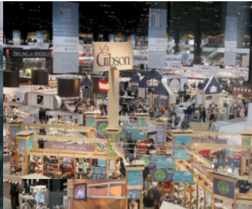
Die Home + Housewares Show in Chicago zieht jedes Jahr Henscharen von Fachbesuchern aus der ganzen Welt an – besonders beliebt sind die Vorführungen verschiedener Starköche (links)